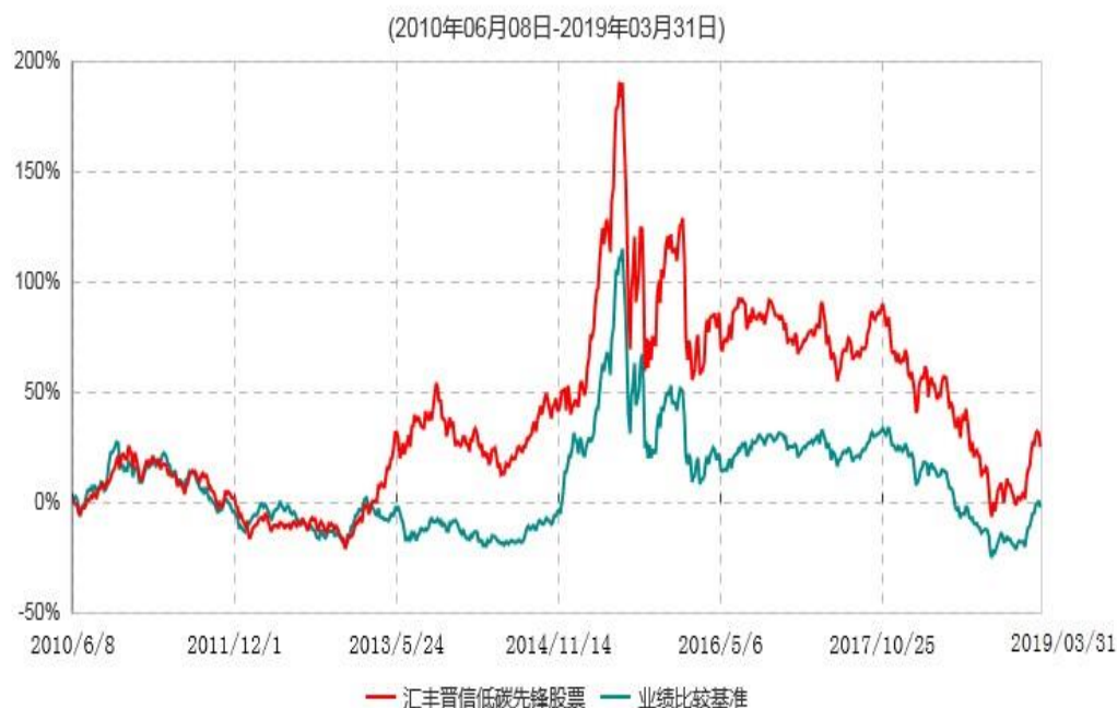
汇丰晋信低碳先锋股票型证券投资基金累计净值增长率与业绩比较基准收益率历史走势对比图