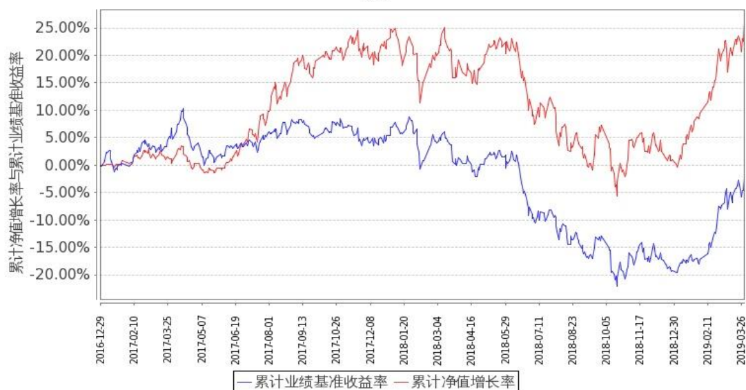
嘉实物流产业股票A累计净值增长率与同期业绩比较基准收益率的历史走势对比图

(二) 自基金合同生效以来基金累计净值增长率变动及其与同期业绩比较基准收益率变动的比较