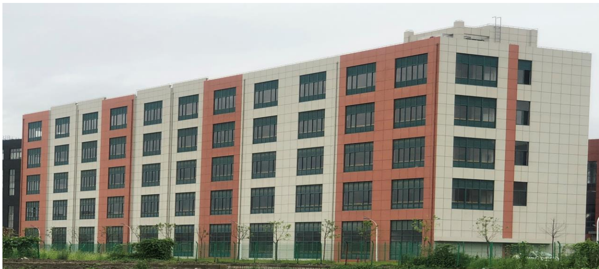
三期厂房建设已经完工