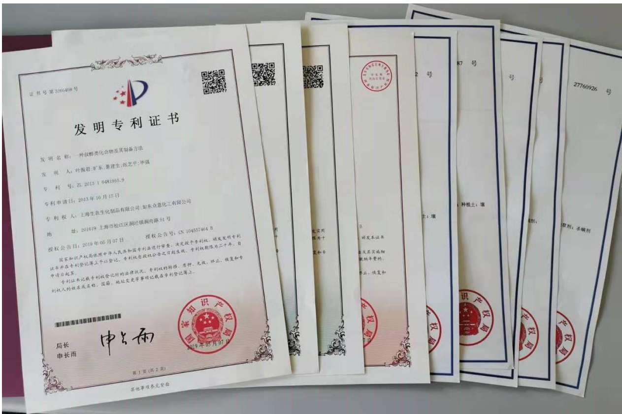
2019 年上半年，公司新增授权发明专利 2 项，实用新型专利 2 项，注册商标 5 件。