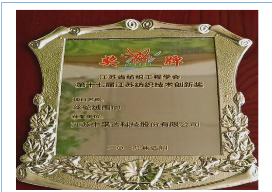
2019 年 4 月公司获得江苏省纺织工程学会第十七届江苏纺织技术创新奖。