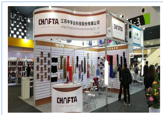
2019 年 3 月 20 日公司参加上海袜子展。