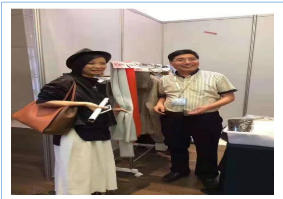
2019 年 3 月 5 日公司参加上海纱线展。