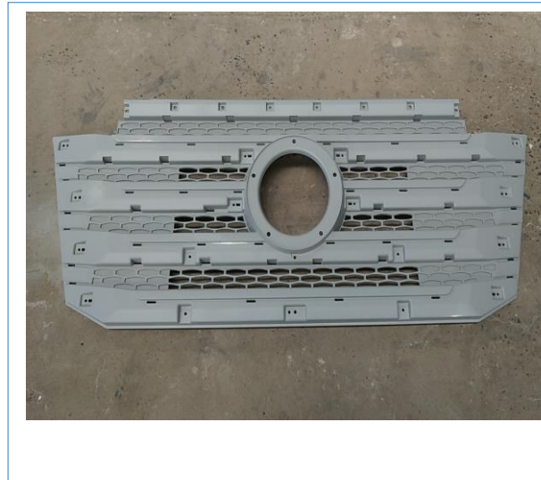
图四：2019年4-6月份，新产品N8V已开模、试压制、小批量供货