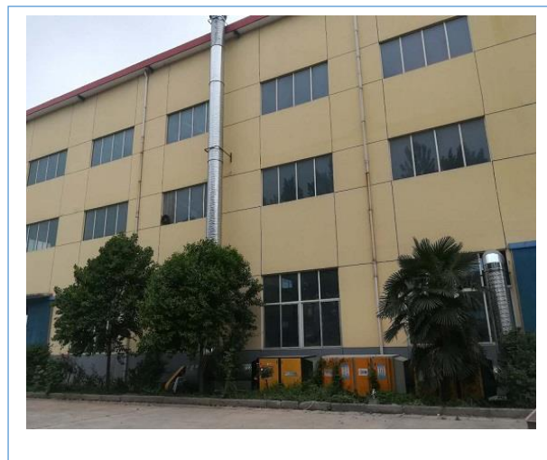
图一（左）图二（右）：2019年4月与液压机配套的废气处理项目已投入运行