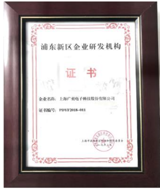
2019年3月，公司获得“浦东新区研发机构”