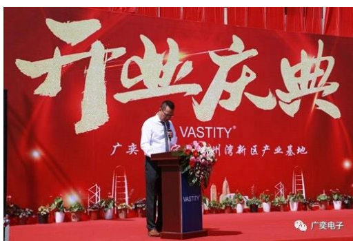
2019年5月，公司杭州湾新区产业基地开业