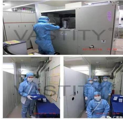
2019年3月，公司顺利完成日本瑞萨砷化镓工厂设备解体