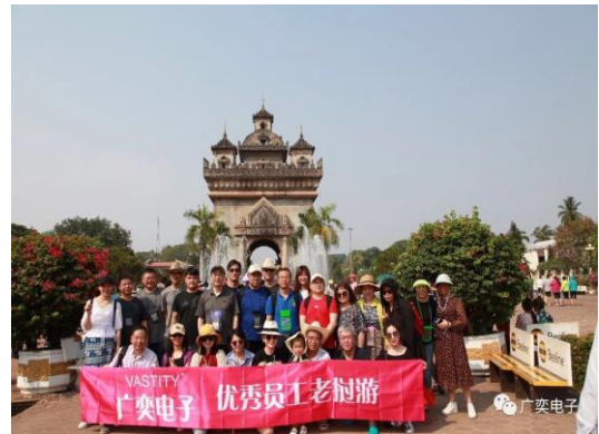
2019年4月，公司优秀员工拓展