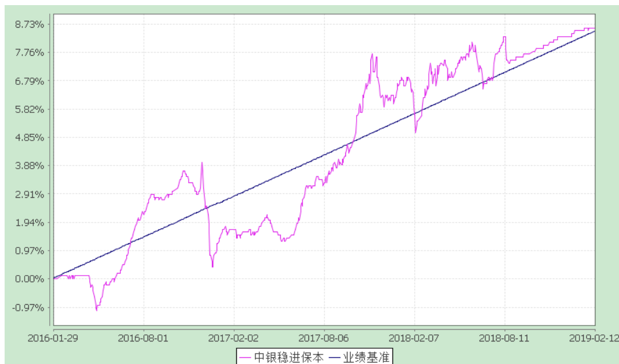
中银稳进保本混合型证券投资基金 份额累计净值增长率与业绩比较基准收益率历史走势对比图 (2016 年 12 月 1 日至 2019 年 2 月 12 日)

注：按基金合同规定，本基金自基金合同生效起 6 个月内为建仓期，截至建仓结束时各项资产配置比例均符合基金合同约定。