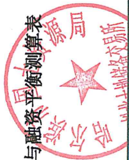
表 5-1 项目收益与融资平衡测算表