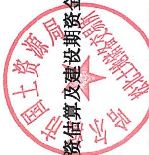
表 2-1 项目投资估算及建设期资金筹措表