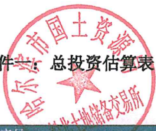
表 1-1 项目总投资估算表