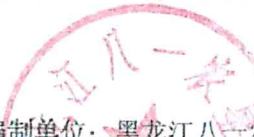
表 2-1 项目投资估算及建设期资金筹措表