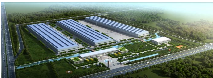
江苏京冶海上风电 轴承制造有限公司