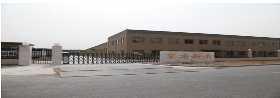
北京京冶轴承 股份有限公司

北京京冶轴承股份有限公司 Beijing Jingye Bearing Co., Ltd.