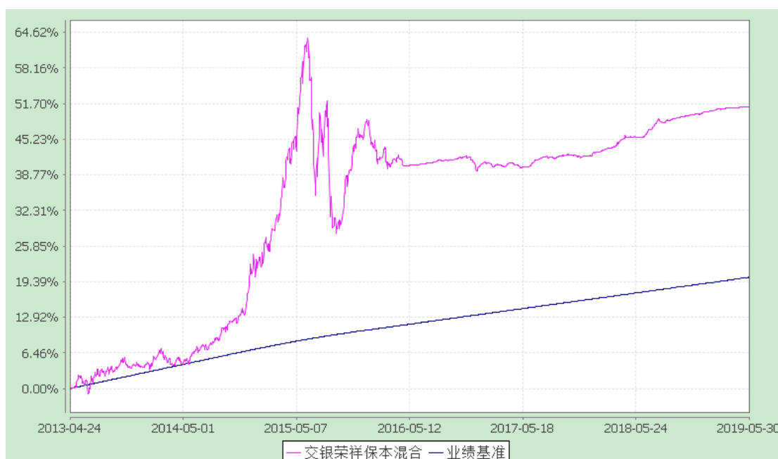
交银施罗德荣祥保本混合型证券投资基金 份额累计净值增长率与业绩比较基准收益率历史走势对比图 (2013年4月24日至2019年5月30日)

注：交银施罗德荣祥保本混合型证券投资基金从2019年5月31日起正式转型为交银施罗德稳固收益债券型证券投资基金，本表列示的是本报告期基金转型前的基金净值表现，转型前基金的业绩比较基准为三年期银行定期存款税后收益率。