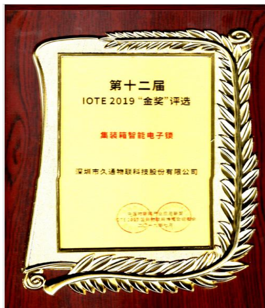
第 12 届 IOTE2019 金奖

1、2019 年 4 月，本公司应邀参加中国海关/口岸/自贸区/特殊监管区智能运行管控系统标准起草工作,同时，应邀参加第九届中国自贸区及特殊区域产业升级论坛并做主题发言。