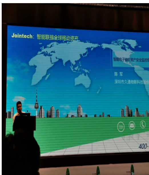
第九届自贸区论坛图片_201904