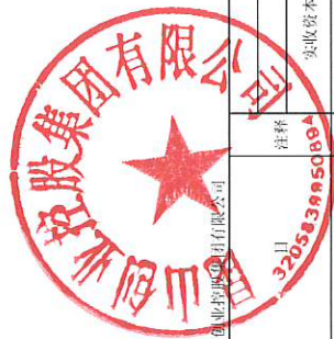
合并所有者权益变动表 2019年1-6月