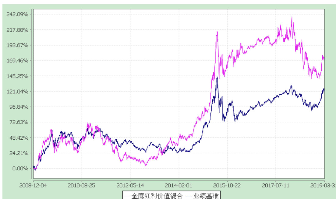
金鹰红利价值灵活配置混合型证券投资基金 累计净值增长率与业绩比较基准收益率历史走势对比图 (2008 年 12 月 4 日至 2019 年 3 月 31 日)