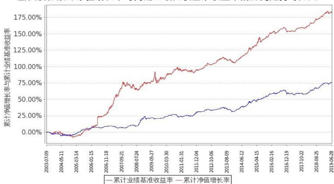
图：嘉实债券份额累计净值增长率与同期业绩比较基准收益率的历史走势对比图