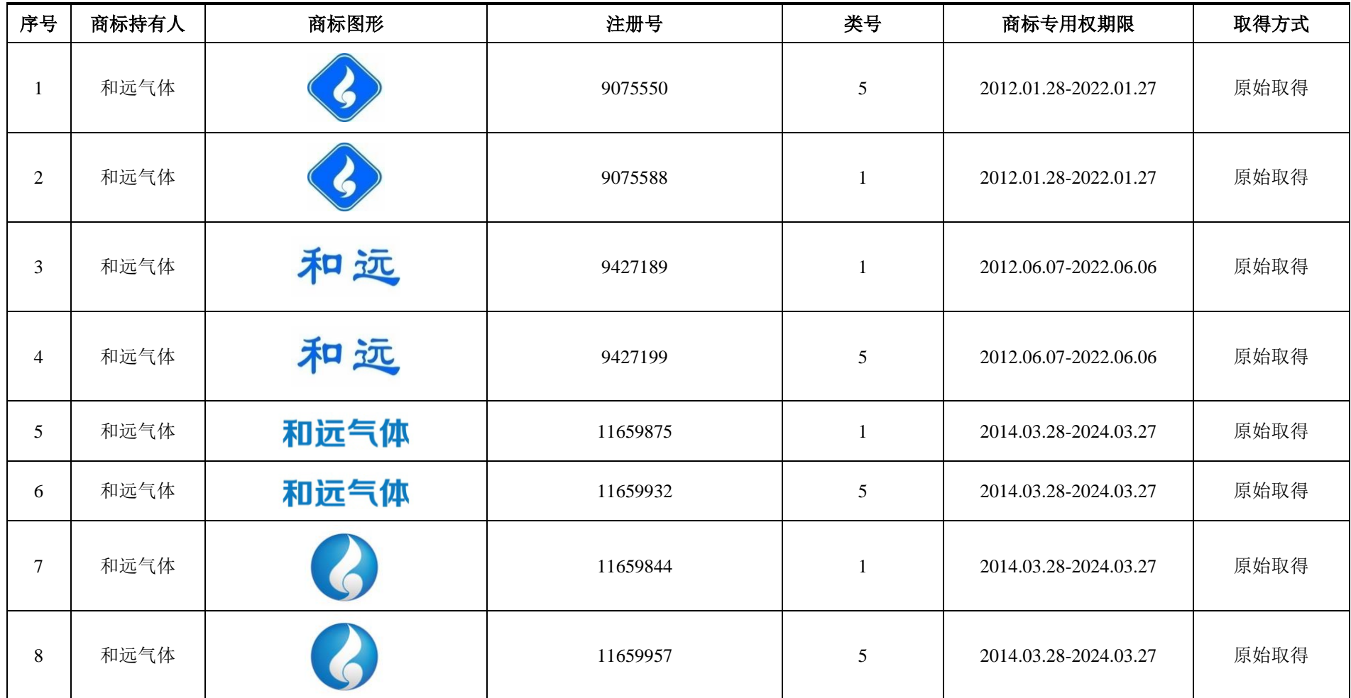
附表六：和远气体及其控股子公司、分公司拥有的注册商标一览表