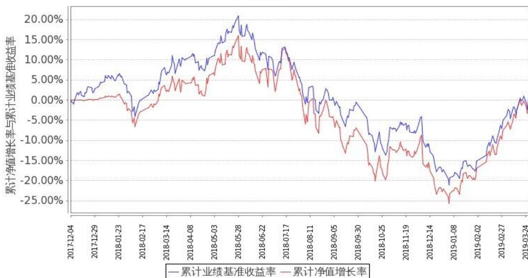
图 1：嘉实医药健康股票 A 基金累计份额净值增长率与同期业绩比较基准收益率的历史走势对比图