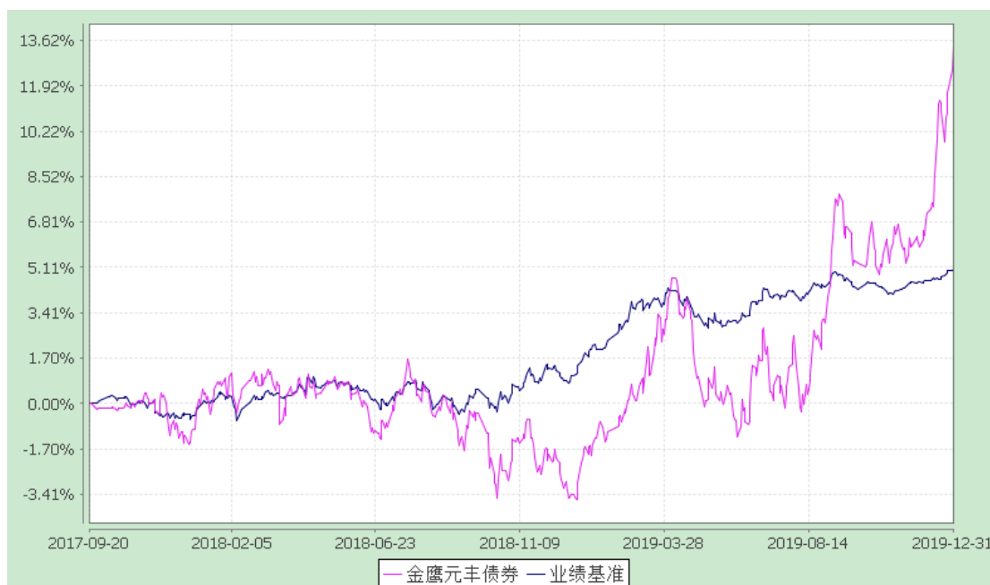
金鹰元丰债券型证券投资基金 累计净值增长率与业绩比较基准收益率历史走势对比图 (2017年9月20日至2019年12月31日)