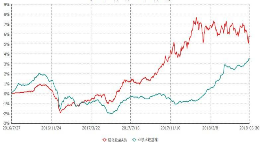
强化收益A类累计净值增长率与业绩比较基准收益率历史走势对比图 (2016年07月27日-2018年06月30日)