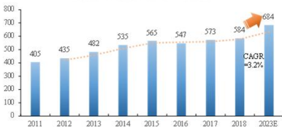
全球通讯市场电子产品产值（十亿美元）