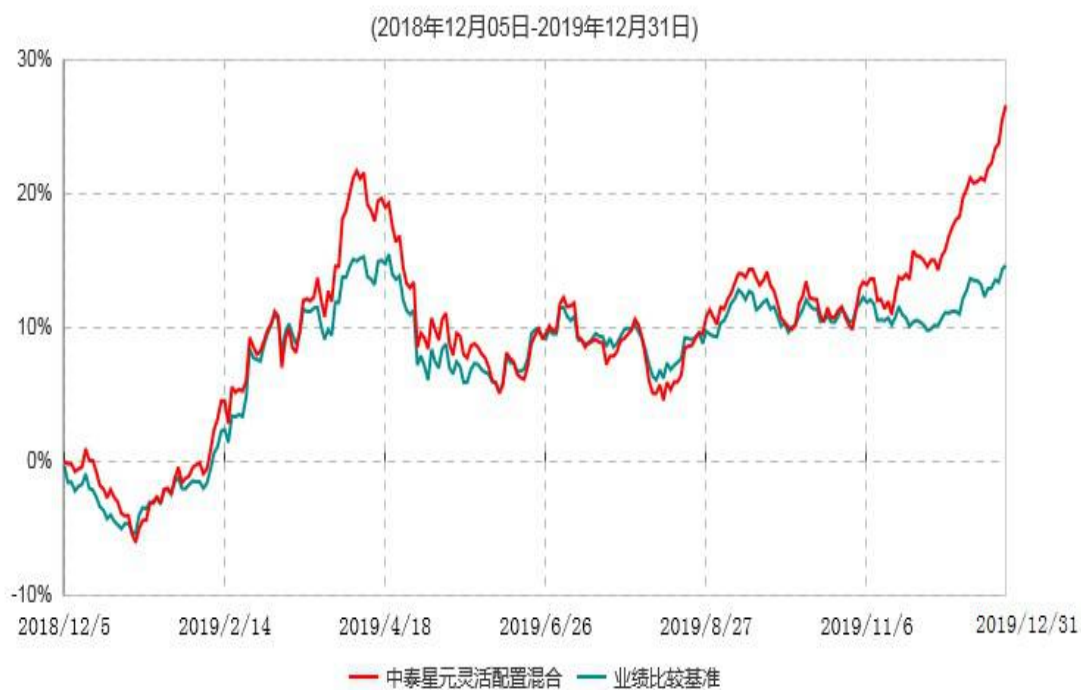
中泰星元价值优选灵活配置混合型证券投资基金累计净值增长率与业绩比较基准收益率历史走势对比图

注：根据基金合同约定，本基金自基金合同生效之日起6个月内为建仓期。建仓期结束时，本基金各项资产配置比例符合基金合同约定。