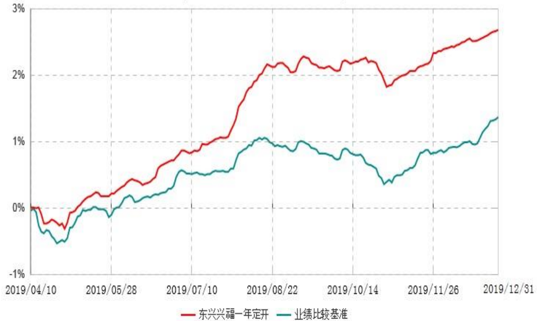
东兴兴福一年定期开放债券型证券投资基金累计净值增长率与业绩比较基准收益率历史走势对比图 (2019年04月10日-2019年12月31日)

注：1、本基金基金合同生效日为2019年4月10日，根据相关法律法规和基金合同，本基金建仓期为基金合同生效之日起6个月内，截至本报告期末已完成建仓但距建仓结束不满一年；