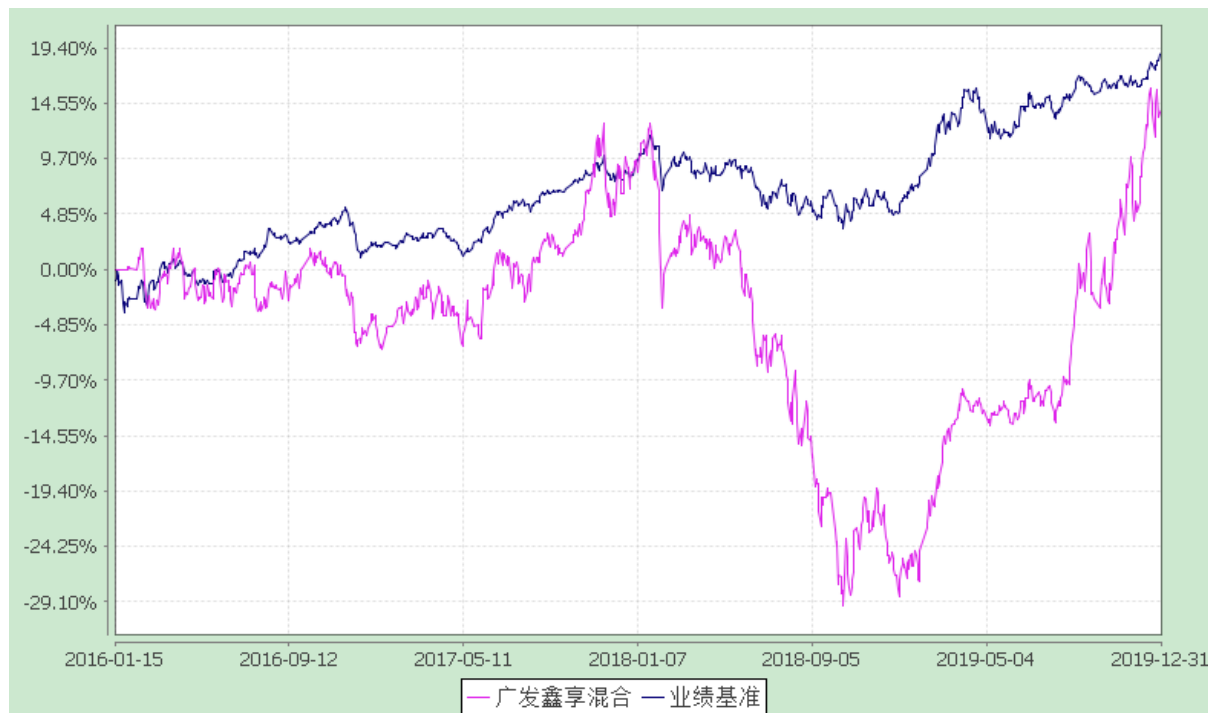
广发鑫享灵活配置混合型证券投资基金 份额累计净值增长率与业绩比较基准收益率的历史走势对比图 (2016 年 1 月 15 日至 2019 年 12 月 31 日)