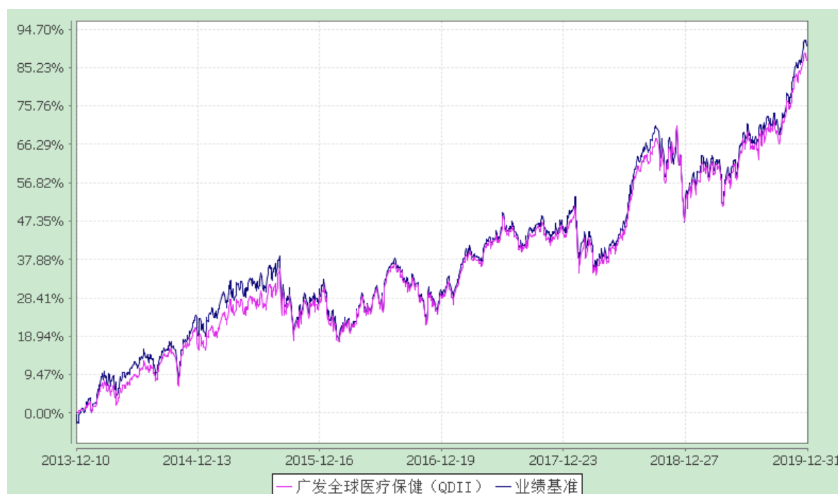
广发全球医疗保健指数证券投资基金 份额累计净值增长率与业绩比较基准收益率历史走势对比图 (2013 年 12 月 10 日至 2019 年 12 月 31 日)