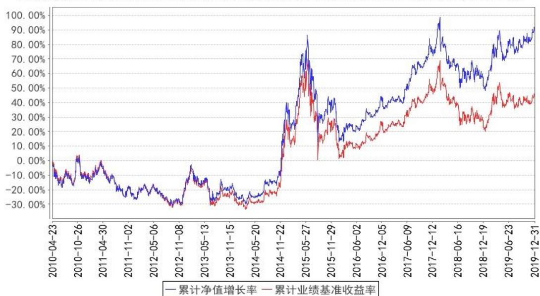
上证180价值ETF累计净值增长率与同期业绩比较基准收益率的历史走势对比图

注:基金依法应自成立日期起 6 个月内达到基金合同约定的资产组合, 截至 2010 年 5 月 28 日, 本基金已达到合同规定的资产配置比例。