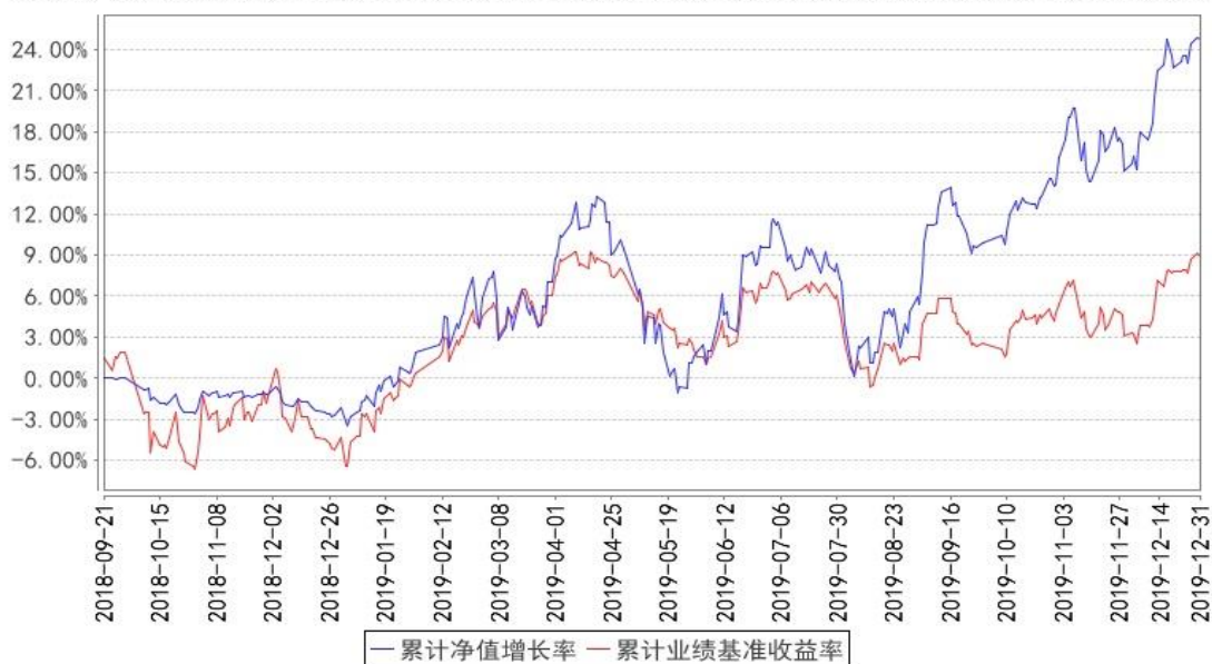
添富沪港深优势定开累计净值增长率与同期业绩比较基准收益率的历史走势对比图

注:本基金建仓期为本《基金合同》生效之日(2018年9月21日)起6个月,建仓期结束时各项资产配置比例符合合同约定。