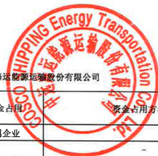
2019年度非经营性资金占用及其他关联资金往来情况汇总表