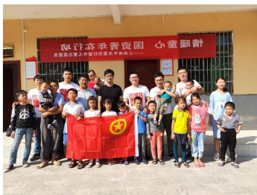
关爱曲江村留守儿童