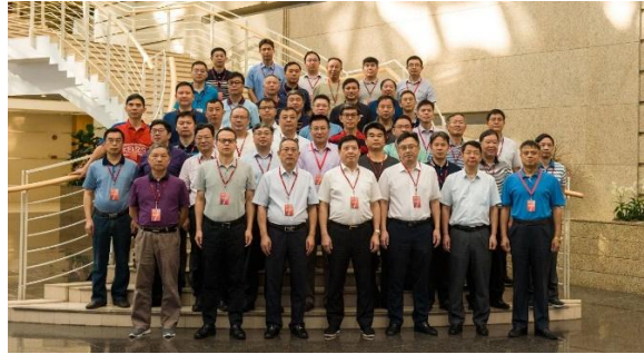
“走进华为”中高层数字化领导力提升研修班