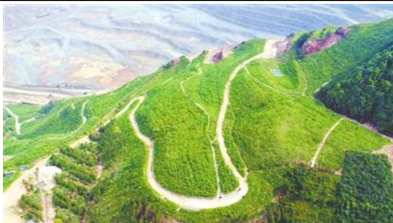
江西铜业德兴铜矿生态复垦后的废石场