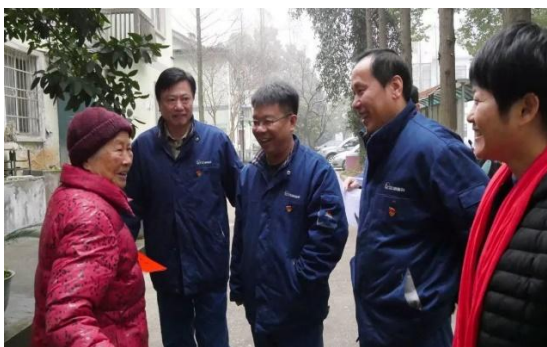
江西铜业“两节”期间发放慰问金