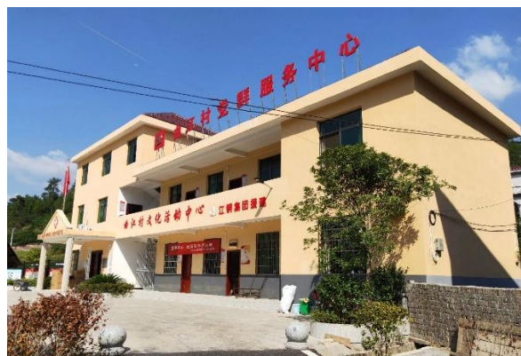
援建曲江村文化活动中心