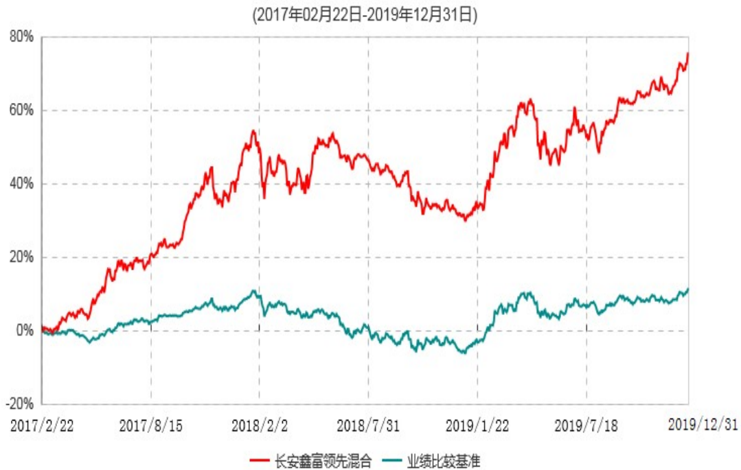
长安鑫富领先灵活配置混合型证券投资基金累计净值增长率与业绩比较基准收益率历史走势对比图

根据基金合同的规定,自基金合同生效之日起6个月内基金各项资产配置比例需符合基金合同要求。本基金在建仓期结束后,各项资产配置比例已符合基金合同有关投资比例