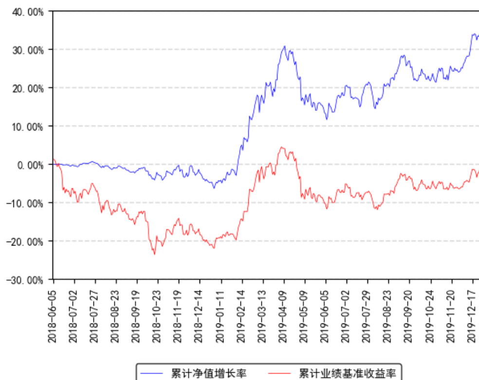
南方潜力新蓝筹混合累计净值增长率与同期业绩比较基准收益率的历史走势对比图

1. 本基金转型日期为 2018 年 6 月 5 日，由原南方丰合保本混合型证券投资基金转型为南方潜力新蓝筹混合型证券投资基金。2. 本基金建仓期为自转型后基金合同生效之日起 6 个月，建仓期结束时各项资产配置比例符合合同约定。