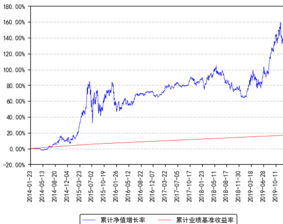
南方医药保健灵活配置混合累计净值增长率与同期业绩比较基准收益率的历史走势对比图