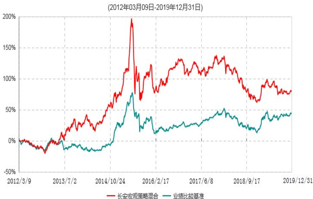
长安宏观策略混合型证券投资基金累计净值增长率与业绩比较基准收益率历史走势对比图