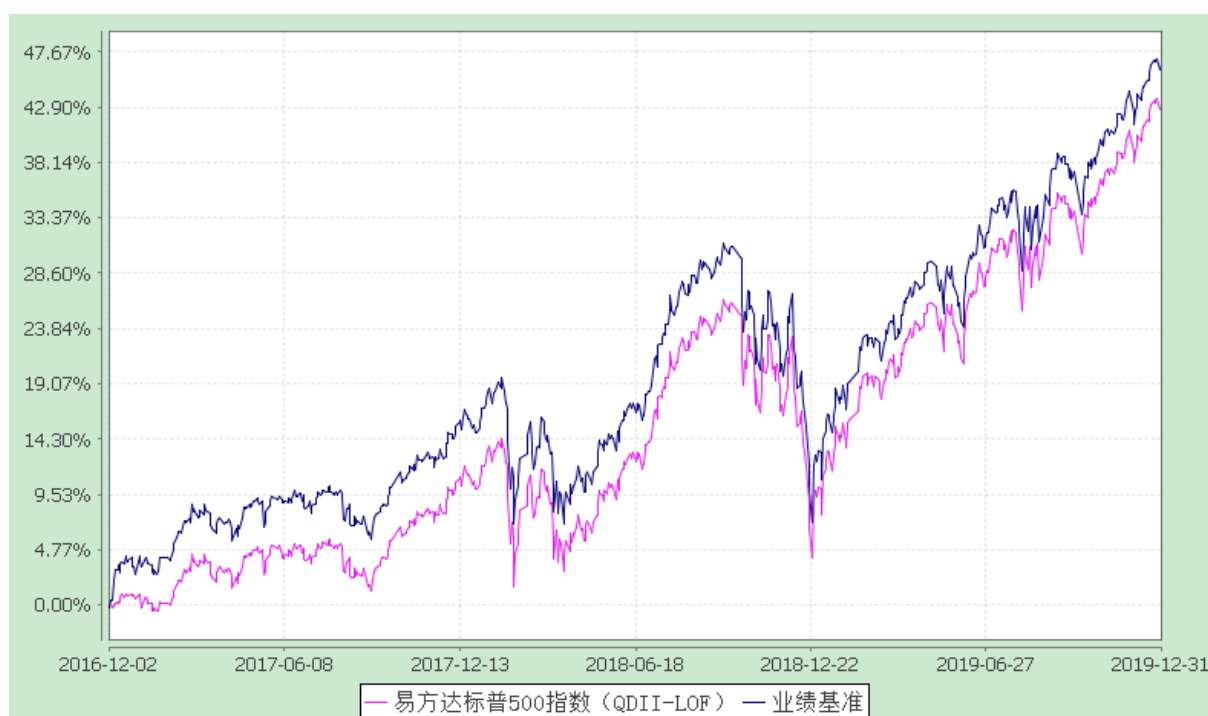
易方达标普 500 指数证券投资基金 (LOF) 份额累计净值增长率与业绩比较基准收益率历史走势对比图 (2016 年 12 月 2 日至 2019 年 12 月 31 日)