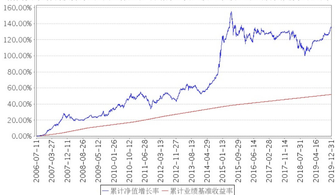
招商安本增利债券累计净值增长率与同期业绩比较基准收益率的历史走势对比图