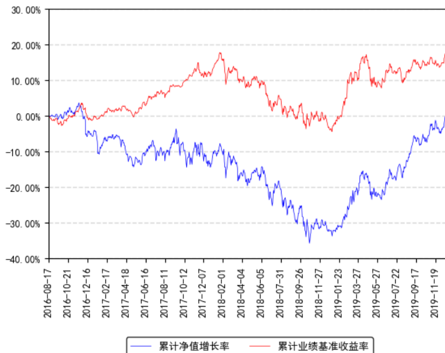
南方转型增长灵活配置混合累计净值增长率与同期业绩比较基准收益率的历史走势对比图