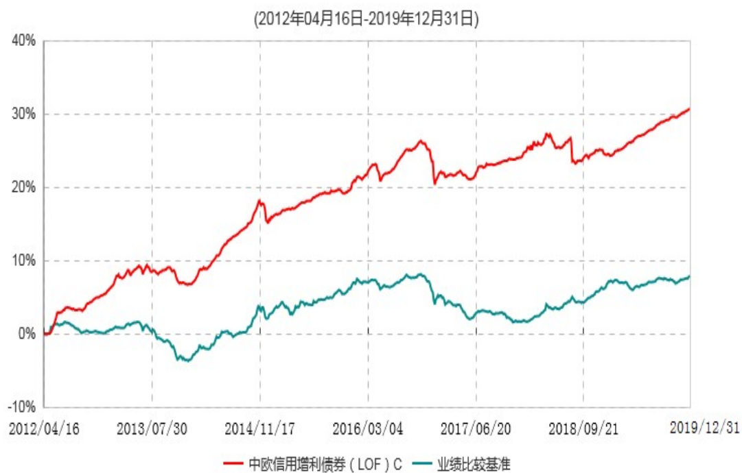
中欧信用增利债券 ( LOF ) C 累计净值增长率与业绩比较基准收益率历史走势对比图