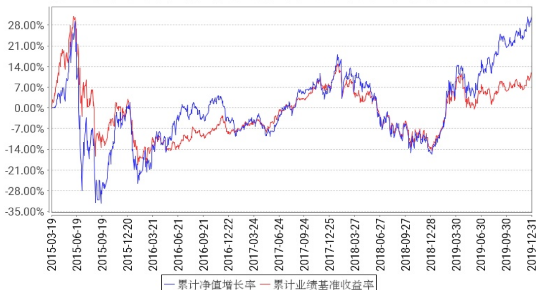
工银新金融股票累计净值增长率与同期业绩比较基准收益率的历史走势对比图