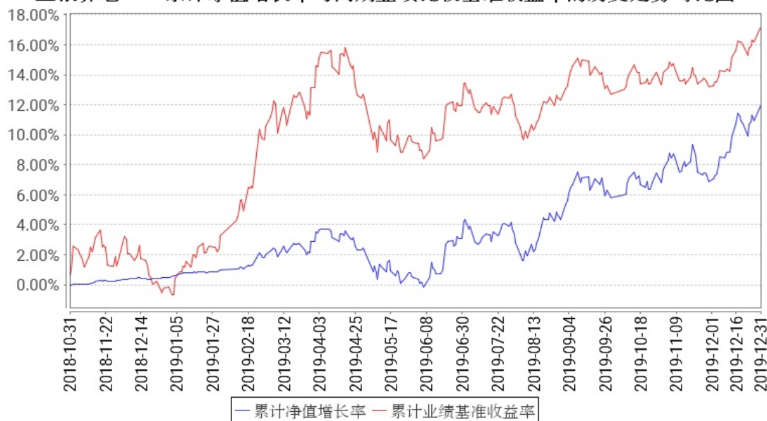
工银养老2035累计净值增长率与同期业绩比较基准收益率的历史走势对比图