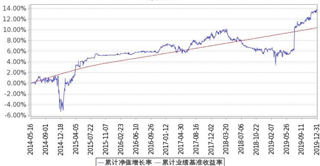
图：嘉实对冲套利定期混合基金份额累计净值增长率与同期业绩比较基准收益率的历史走势对比图