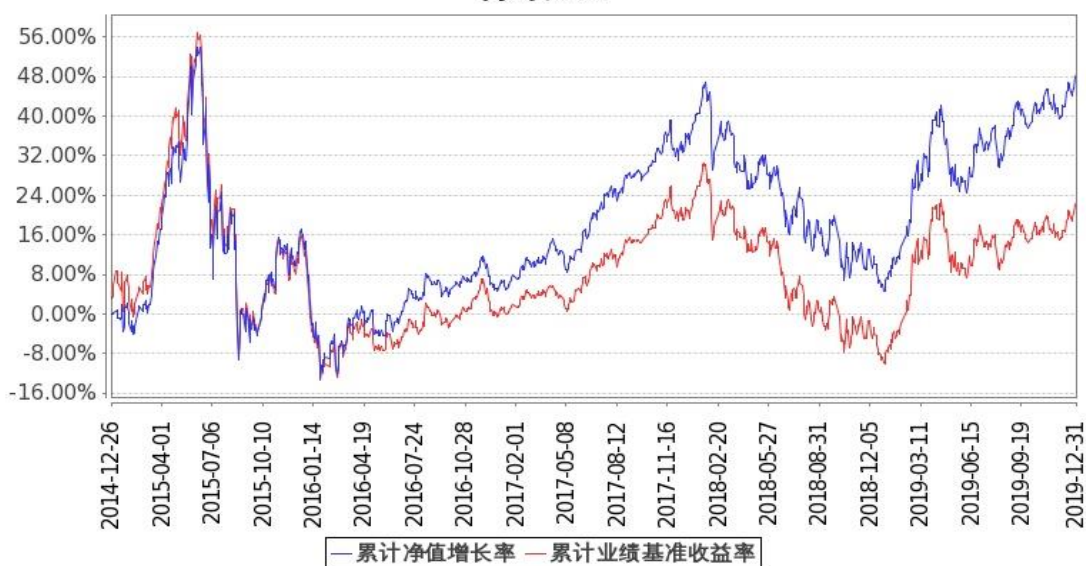
图：嘉实沪深 300 指数研究增强基金份额累计净值增长率与同期业绩比较基准收益率的历史走势对比图