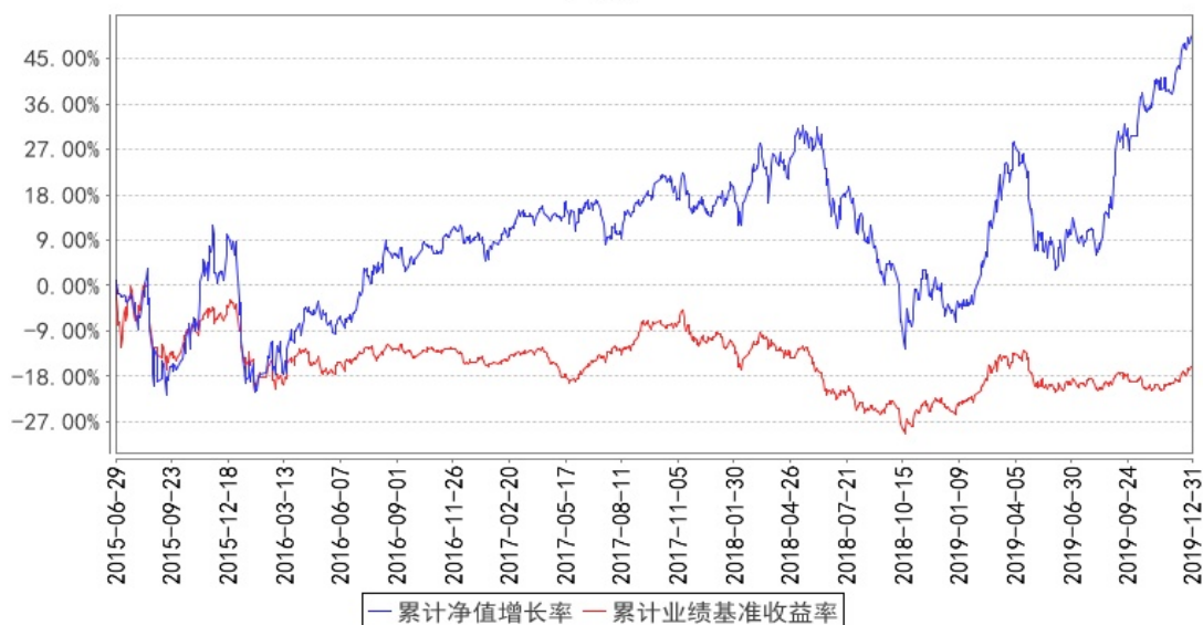
融通新能源灵活配置混合累计净值增长率与同期业绩比较基准收益率的历史走势对比图