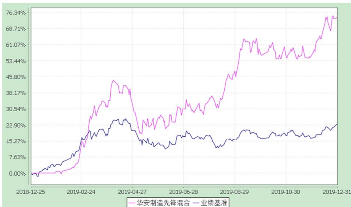
自基金合同生效以来份额累计净值增长率与业绩比较基准收益率的历史走势对比图 (2018 年 12 月 25 日至 2019 年 12 月 31 日)