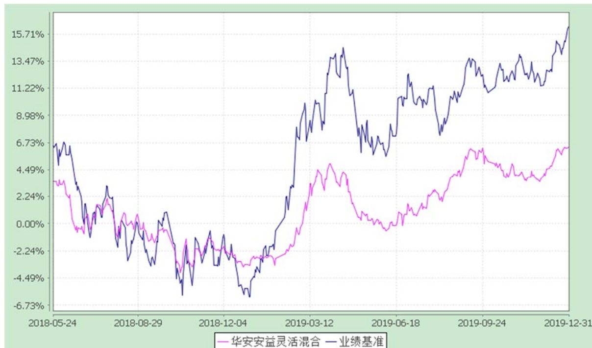
自基金转型以来份额累计净值增长率与业绩比较基准收益率的历史走势对比图 (2018 年 5 月 24 日至 2019 年 12 月 31 日)