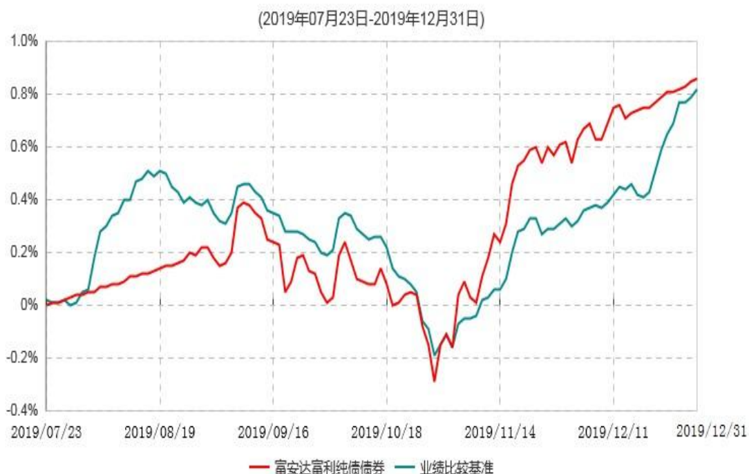
富安达富利纯债债券型证券投资基金累计净值增长率与业绩比较基准收益率历史走势对比图

注：本基金于2019年7月23日成立，本基金建仓期为本基金合同生效之日起六个月，建仓截止日为2020年1月22日。建仓期结束时本基金各项资产配置比例符合本基金合同规定的比例限制及投资组合的比例范围。