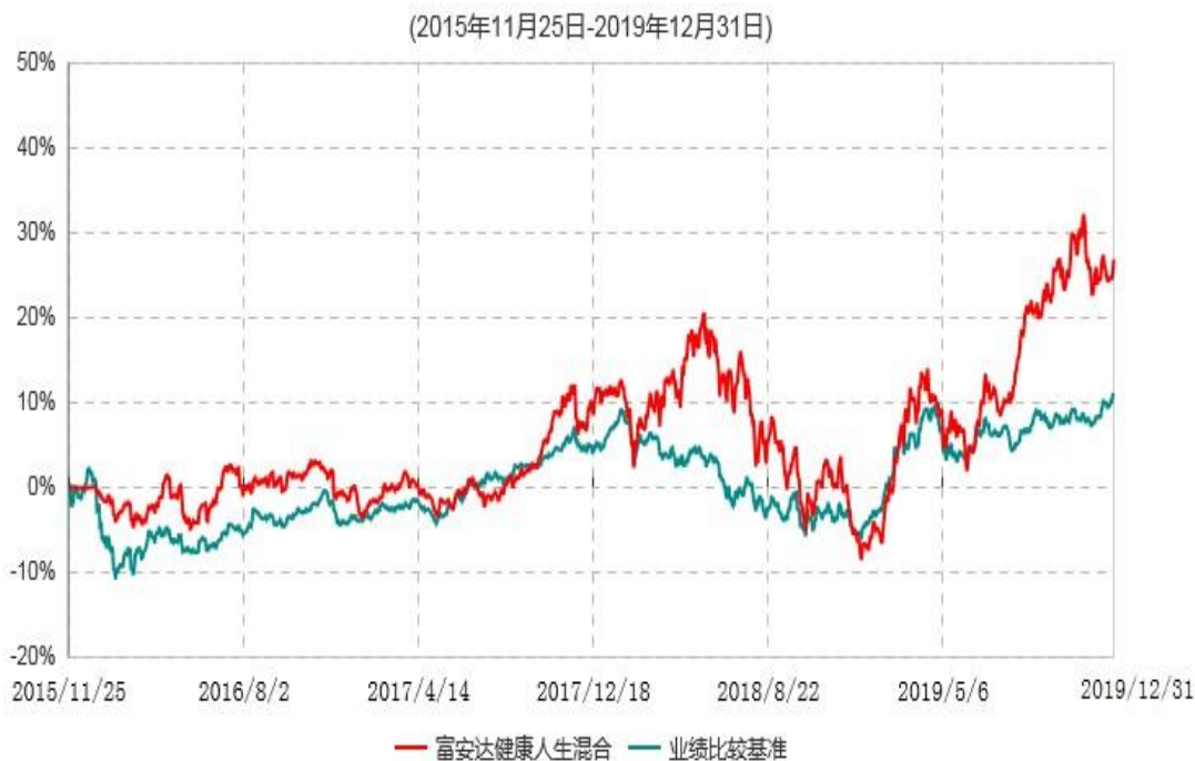
富安达健康人生灵活配置混合型证券投资基金累计净值增长率与业绩比较基准收益率历史走势对比图

注：根据《富安达健康人生灵活配置混合型证券投资基金基金合同》规定，本基金建仓期为6个月，建仓截止日为2016年5月24日。建仓期结束时本基金各项资产配置比例符合本基金合同规定的比例限制及投资组合的比例范围。