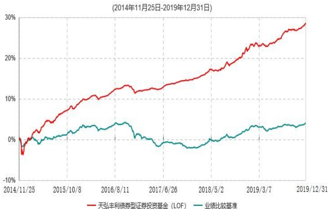
天弘丰利债券型证券投资基金（LOF）累计净值增长率与业绩比较基准收益率历史走势对比图

注：1、本基金合同于2011年11月23日生效，本基金于2014年11月24日三年封闭期届满，封闭期届满后本基金自动转换为上市开放式基金（LOF），基金名称变更为“天弘丰利债券型证券投资基金（LOF）”，封闭期届满日为本基金份额转换基准日。