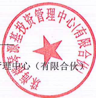
珠海横琴源基投资管理中心（有限合伙）