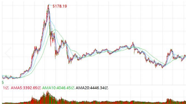
图 1：2014-2019 上证综合指数变化趋势图

证券行业的运营表现与宏观经济环境高度相关。2016 年底，中央经济工作会议定调，要稳中求进、去杠杆，大力发展实体经济，2017 年 A 股出现慢牛格局。2017 年全年，上证指数全年振幅 13.98%，截至 2017 年末，上证综指收盘收于 3,307.17 点，较年初上涨 6.56%。2018 年，受中美贸易战、国内经济增速放缓等内外部因素影响，上证综指震荡下跌，截至 2018 年末，上证综指收盘于 2,493.90 点，较年初下跌 24.59%。2019 年以来，国内财政政策整体趋于宽松，市场情绪回暖，风险偏好提升，但结构性问题依然存在，国内外环境呈现不确定性，A 股市场一季度呈现活跃，之后受到国内外宏观因素的影响出现持续波动，但市场行情总体回暖，年末上证综指收于 3,050.12 点，较上年末涨幅 22.30%。