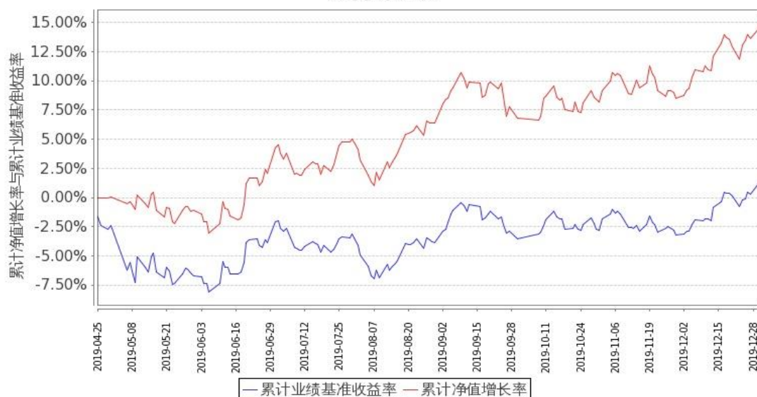
嘉实养老 2050 混合（FOF）累计净值增长率与同期业绩比较基准收益率的历史走势对比图