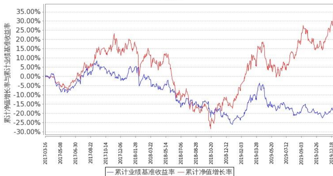
图1：嘉实新能源新材料股票A基金份额累计净值增长率与同期业绩比较基准收益率的历史走势对比图